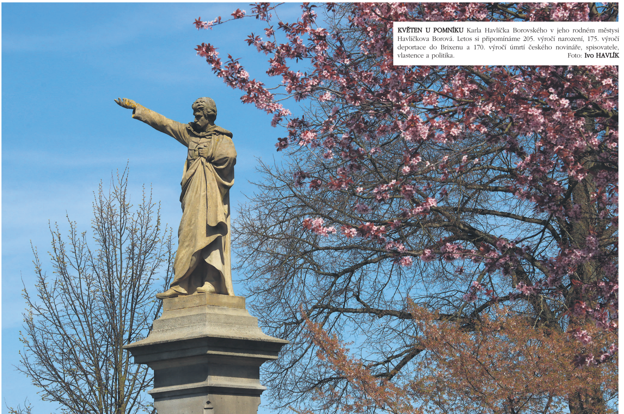
KVĚTEN U POMNÍKU Karla Havlíčka Borovského v jeho rodném městyse Havlíčkova Borová. Letos si připomínáme 205. výročí narození, 175. výročí deportace do Brixenu a 170. výročí úmrtí českého novináře, spisovatele, vlastence a politika.